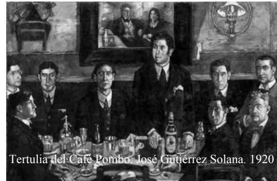
Tertulia del Café Pombo. José Gutiérrez Solana. 1920

En los museos de reproducciones escultóricas es donde los papás oyen a los niños las cosas más insólitas: —¡Papá, a mí no me ha salido aún la hoja!