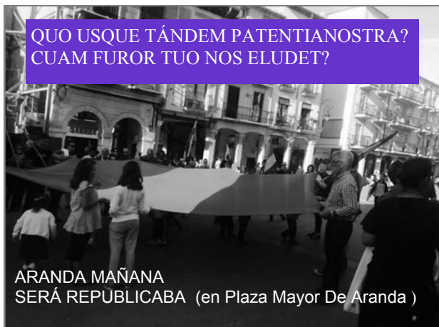
ARANDA MAÑANA SERÁ REPUBLICABA (en Plaza Mayor De Aranda)

QUO USQUE TÁNDEM PATENTIANOSTRA? CUAM FUROR TUO NOS ELUDET?