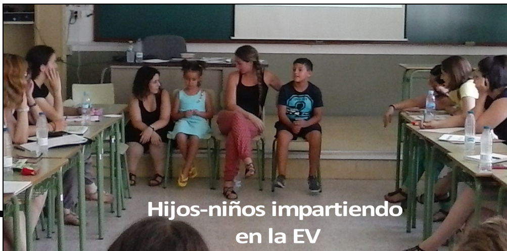
Hijos-niños impartiendo en la EV