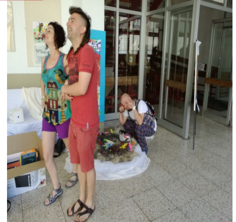
Y el pobre de Caravaca comerá caca de vaca.