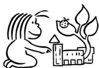
Grupo de Trabajo: La Ciudad de los Niños

Cuenta con el asesoramiento y el apoyo del grupo de "La città dei bambini" del Consejo Nacional de Investigación (CNR) de Roma dirigido por Francesco Tonucci . Está integrado por profesionales de muy diversa formación y experiencia.