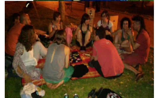
Cónclavelésbico y poliamoroso