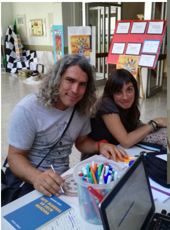
Victor y Samotracia