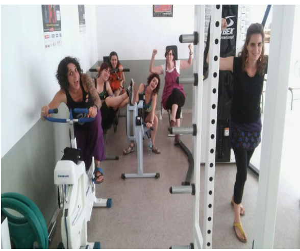
La Escuela de Verano se pone en forma