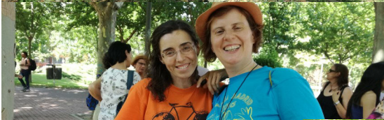
Diversa y anversa