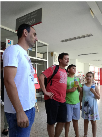
Presidente Mayor, hijos y el del yo-yo