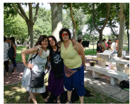
Ajo, perejil y yerbabuena