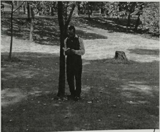
Gerardo Diego leyendo a Walt Whitman