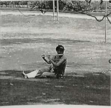
En una noche oscura Walt Whitman cantando a Walt Whitman

Parte del poema "ODA A LA INMORTALIDAD" de William Wordsworth