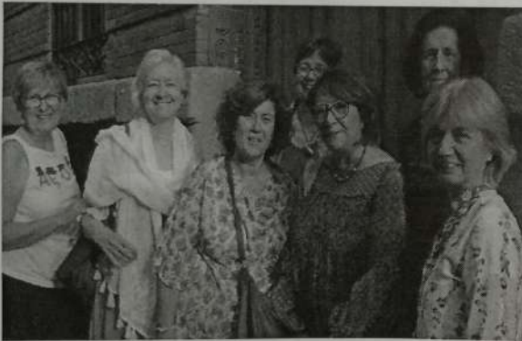
(Servicio Público de Empleo)

A la hora de elegir los Ciclos, hay poca información, funcionan los estereotipos, de clase, de género, habría que trabajarlo más en profundidad antes del proceso de admisión. Tendría que incluirse en las distintas materias, de modo transversal en la ESO, que el alumnado conozca el campo profesional de cada área de conocimiento, incluyendo visitas a empresas, intercambios con profesionales, etc. en definitiva, hay que mejorar la orientación profesional.