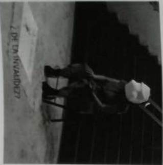
¿POR QUÉ INVISIBLE?

!!!Muchas gracias Sierra por el trabajo compartido y por el entusiasmo y pasión que contagias siempre!!!