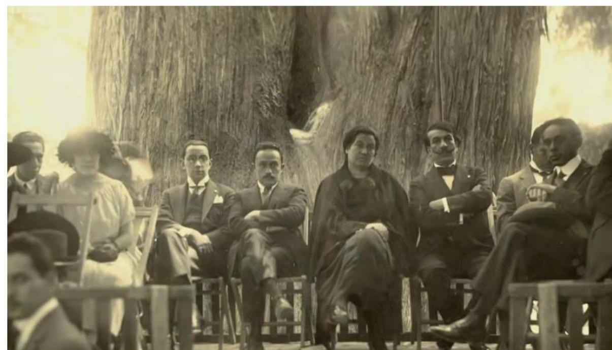
Festival en Chapultepec. Sentados de izquierda a derecha: Antonio Caso, José Vasconcelos, Gabriela Mistral y Alfredo Palacios, en un festival de la SEP, Bosque de Chapultepec.

Su hijo Héctor Vasconcelos, hoy senador de la República de México, reflexiona también sobre la deriva posterior de su padre: “Creo que después de la campaña de 1929 (cuando fue candidato presidencial) entró en una profundísima crisis psicológica ante la forma en que fue combatido por el régimen del naciente Partido Nacional Revolucionario (PNR)” ...desarrollando una aversión en contra de todo lo que fueran movimientos revolucionarios..... lo cual a mí me parece la peor tragedia de su vida. Creo que esto fue una catástrofe personal.”